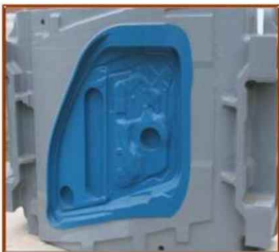
Modelo Matriz para Estampado Renault

La fabricación de los mismos se realiza bajo modernos sistemas Informáticos quienes permiten calcular .